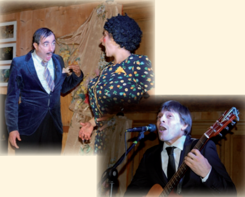
Ce dernier sera programmé dans le cadre du Festival La Beauce du Théâtre à Beaune-la-Rolande en août 2011. L'appel à animations est d'ailleurs lancé depuis le mois d'octobre. Si vous souhaitez participer aux animations La Route du Blé en 2011, contactez le Pays !