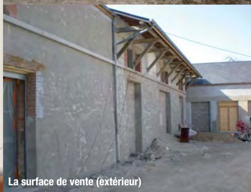
La surface de vente (extérieur)