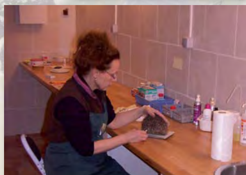
Soin donné à un hérisson Laboratoire de Bazoches