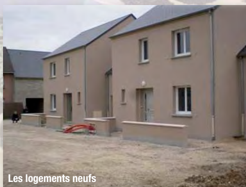
Les logements neufs

La prochaine étape sera la réalisation du crépi sur toutes les parties réhabilitées, puis viendront les finitions extérieures, l'éclairage, les parkings et les accès pour une livraison à la rentrée prochaine.