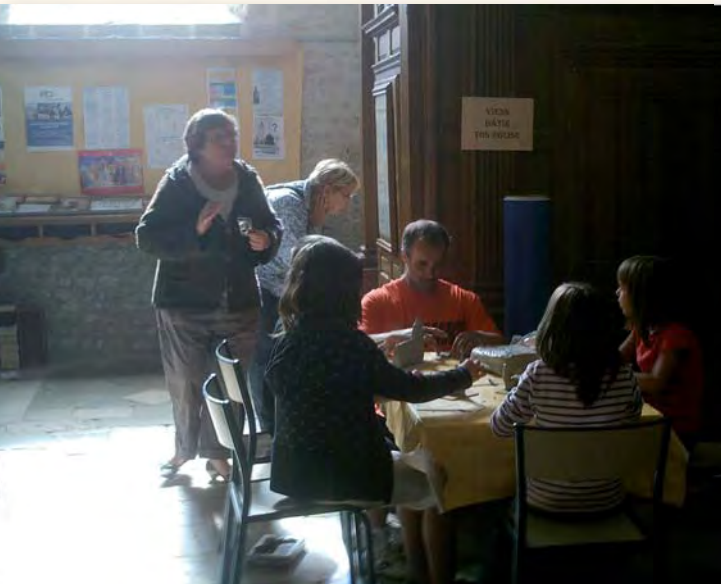
Atelier de modelage sur le thème "l'église de mon village".

Lors des journées du patrimoine l'église de Bazoches-les-Gallerandes était ouverte au public ou un diaporama sur la restauration du clocher en circuit fermé était proposé ainsi que l'exposition sur la manière de faire une icône, un jeu question et réponse sur l'histoire biblique pour tester ses connaissances et un atelier de modelage sur le thème "l'église de mon village". Beaucoup de témoignages de reconnaissance de la population sur la rénovation du clocher et sur la suite des travaux envisagée.