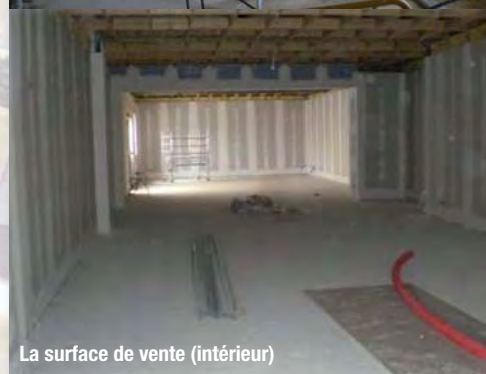
La surface de vente (intérieur)