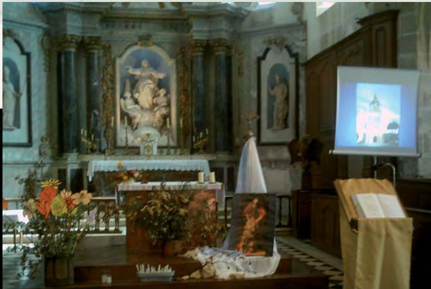
Diaporama sur la restauration du clocher.