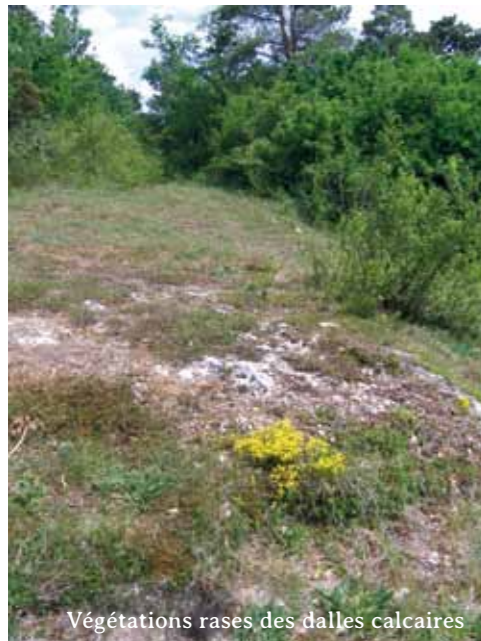
Végétations rases des dalles calcaires