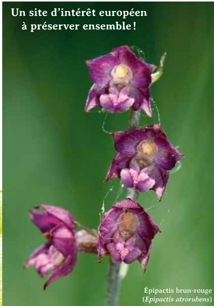
Épipactis brun-rouge (Epipactis atrorubens)