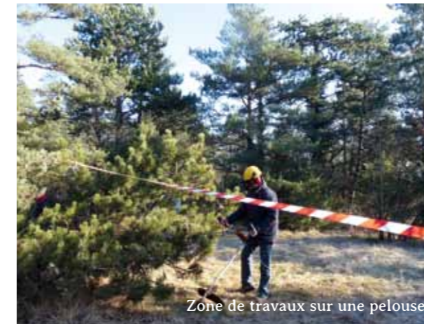
Zone de travaux sur une pelouse