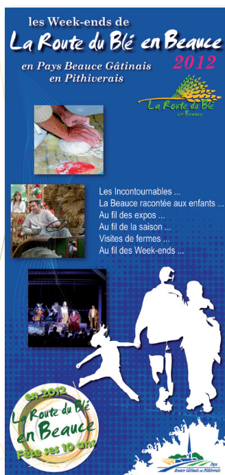
Visuel des Week-ends 2012

Chaque année à l'occasion des « Week-ends de La Route du Blé en Beauce » le territoire se dévoile grâce à des animations proposées de mars à octobre : visites de villages, d'exploitations agricoles, concerts, fêtes traditionnelles, spectacles ... Le millésime 2012 sur le territoire du Pays Beauce Gâtinais en Pithiverais vous invite ainsi à 60 rendez-vous !