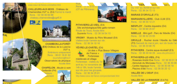
Extrait de la carte 2012

Ce dernier document sera disponible dès la fin du mois de mars dans les offices de tourisme, les mairies... Il sera présenté en exclusivité aux prestataires touristiques lors de la Bourse touristique du Comité départemental du tourisme du Loiret qui se tiendra le 5 avril à Sully-sur-Loire.