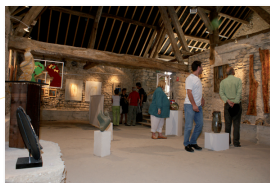
Exposition en 2011 au Centre Les Temps d'Art