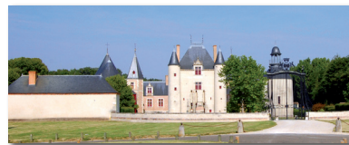
Château de Chamerolles