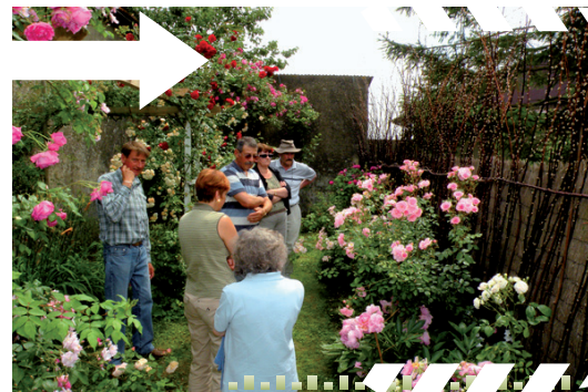
Visite du jardin de Pierre la Bouture à Autruy/Juine en 2011

Pour illustrer la richesse des animations prévues pour la saison, voici une petite sélection des manifestations auxquelles vous pourrez assister :