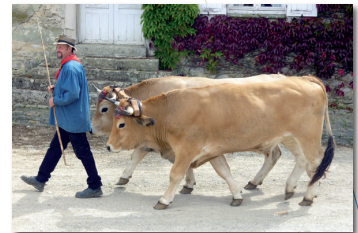
Fête des moissons de Manchecourt en 2011