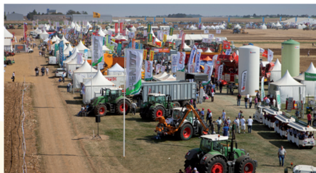
Le territoire accueille tous les deux ans le plus grand salon européen en extérieur pour le machinisme agricole « Innov'Agri »