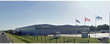
Forte de 70 années d'expérience, la société JOURDAIN est le 1 er constructeur mondial de matériel bovin.

GALVA 45, JOURDAIN, SOFEDIT, SOMAVA ERCOMES, STCM, TOUTENKAMION ... sont les fers de lance de la filière métallurgique du territoire. Troisième employeur du bassin de vie, ils participent largement à son dynamisme.